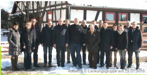
Auftakt ILE-Lenkungsgruppe am 19.01.2016